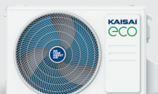
Jednostka zewnętrzna KEX